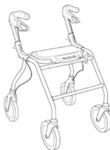
FUTURA 600 Art nr. 12070-43-21