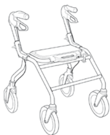
FUTURA 450 Art nr. 12074-43-21