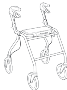
FUTURA 680 Art nr. 12076-43-21