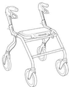
FUTURA 520 Art nr. 12072-43-21