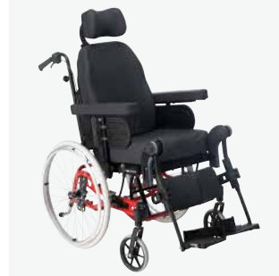
Rea Azalea Tall Rea Azalea Tall är av allra högsta kvalitet när det gäller komfort och stabilitet.