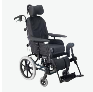
Rea Azalea Minor Körhandtagen är utåtvinklade för att ge ett utökat utrymme för vårdaren.

Rea Azalea Tall är speciellt utvecklad för att möta behoven hos långa brukare och brukare som kräver en sitstilt samt längre och högre stödytor. Liksom Rea Azalea har Rea Azalea Tall alla de fördelar när det gäller säkerhet vid tiltning av rullstolen och erbjuder dessutom en unik glidande balanspunkt.