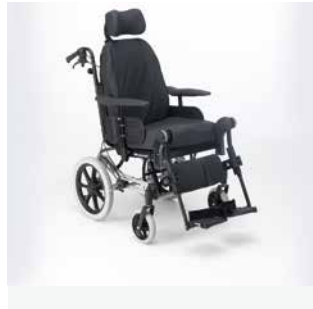
Rea Azalea Assist Transportversionen med små drivhjul.