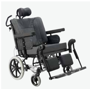
Framtagen för att möta behovet hos brukare med extra vikt.