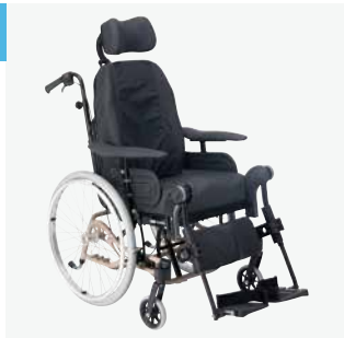
Rea Azalea Originalet med stora drivhjul, som du kan köra själv.