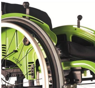
Sidoskydd aluminium med stänkskärm (här också med Safaribroms)