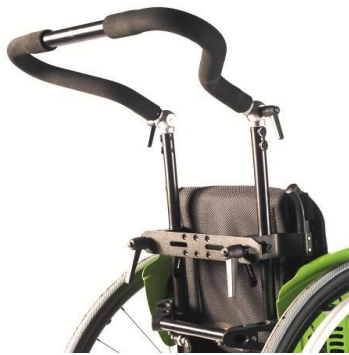
Körbåge, höjd-, vinkel- och breddjusterbar