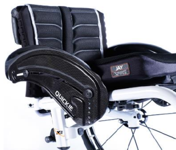
XES040104 Sidoskydd, kolfiber med stänkskärm