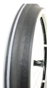
XES070208 Drivring Maxgripp (ergo para cp modell)