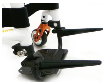
XES090019 Caddy, väskhållare