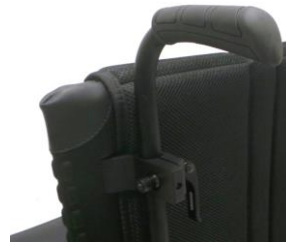
XES 030204 Körhandtag, höj- och sänkbara