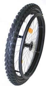
XES07010 Mountainbike hjul