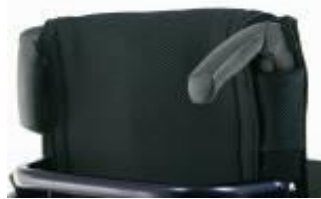
XES 030203 Körhandtag fällbara