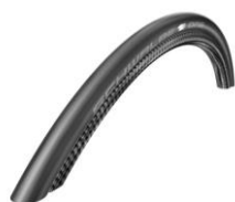
XES070107 Schwalbe One