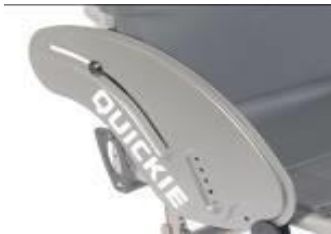
XES040102 Sidoskydd, aluminium , utan stänkskärm