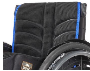
XES 030317 EXO PRO Evo rygglädsel