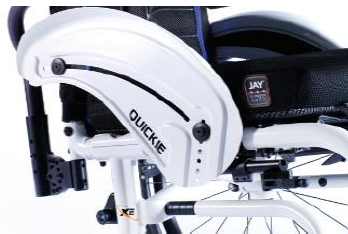
XES040103 Sidoskydd aluminium, med stänkskärm