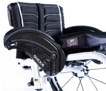
XES040104 Sidoskydd, kolfiber med stänkskärm