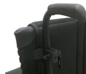
XES 030204 Körhandtag, höj- och sänkbara