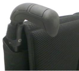
XES 030201 Körhandtag långa