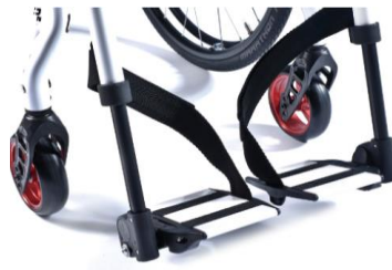
XES050022 Fotplattor delade, aluminium, ramfärg