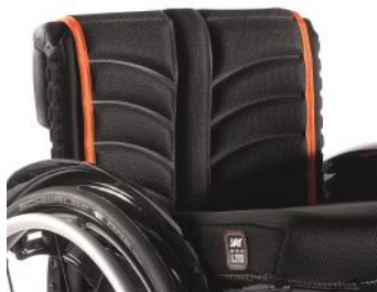
XES 030317 EXO PRO rygglädsel