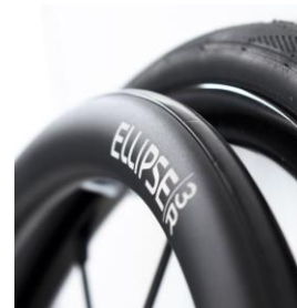
XES070212 Driving Ellipse 3R, svart