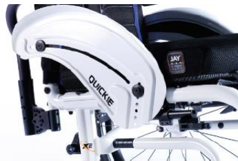
XES040103 Sidoskydd aluminium, med stänkskärm