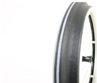
XES070208 Driving Maxgripp (ergo para cp modell)