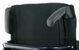
XES 030203 Körhandtag fällbara