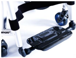
XES050132 Fotplatta hel, lättvikt kolfiber