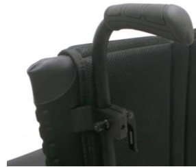
XES 030204 Körhandtag, höj- och sänkbara