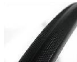
XES070102 Däck punkterinsskyddat