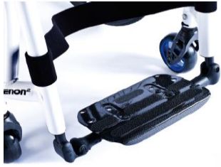
XES050132 Fotplatta hel, lättvikt kolfiber