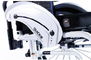
XES040103 Sidoskydd aluminium, med stänkskärm