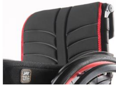
XES 030316 EXO Evo rygglädsel