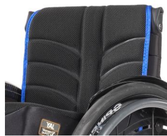
XES 030317 EXO PRO Evo rygglädsel