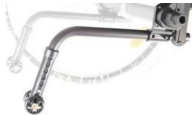
XES090050 Tippskydd, löstagbara, plug in