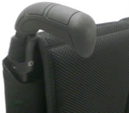
XES 030201 Körhandtag långa