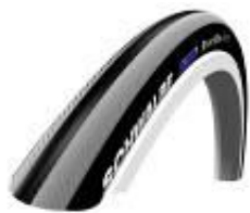
XES070101 Schwalbe Right Run