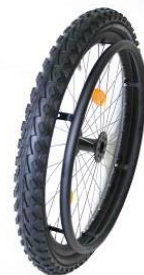
XES07010 Mountainbike hjul