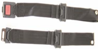
XES 090018 Positioneringsbälte med låsning