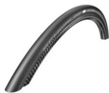
XES070107 Schwalbe One