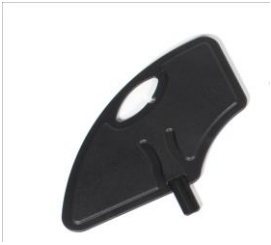
XES040107 Sidoskydd löstagbart komposit