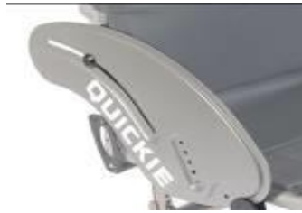
XES040102 Sidoskydd, aluminium, utan stänkskärm