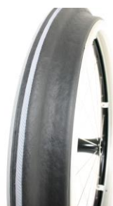
XES070208 Drivring Maxgripp (ergo para cp modell)