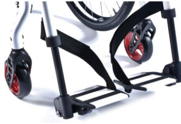
XES050022 Fotplattor delade, aluminium, ramfärg