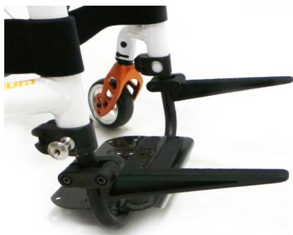
XES090019 Caddy, väskhållare