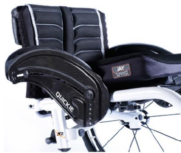
XES040104 Sidoskydd, kolfiber med stänkskärm