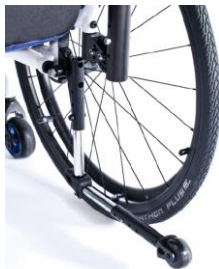
XES090004 Tippskydd, swing away