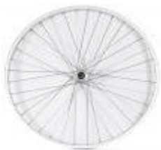
XES070001 Universalhjul, kryssekrat