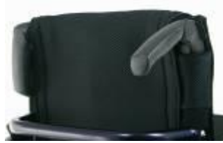
XES 030203 Körhandtag fällbara