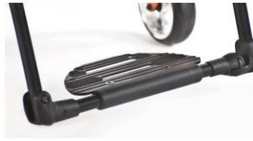
XES050059 Fotplatta hel, Performance