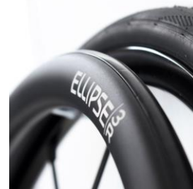
XES070212 Drivring Ellipse 3R, svart