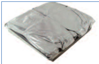
Underfylld i båda kamrarna