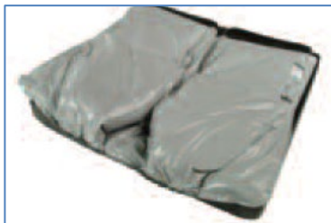
Överfylld i båda kamrarna