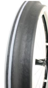
XFF070208 Drivring Maxgripp (ergo para cp modell)