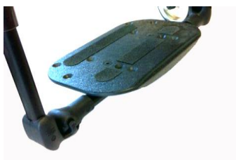
XFF050131 Fotplatta hel, komposit