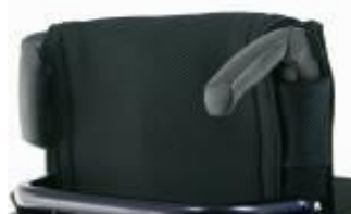
XFF 030203 Körhandtag fällbara