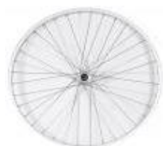
XFF070001 Universalhjul, kryssekrat