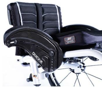
XFF040104 Sidoskydd kolfiber med stänkskärm