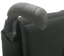
XFF 030201 Körhandtag långa