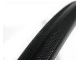
XFF070102 Däck punkteringskyddat