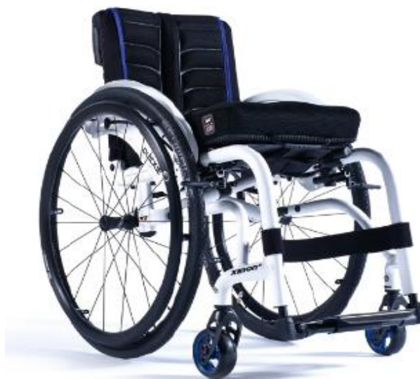
XFF090020 / 21 Förstärkt ram