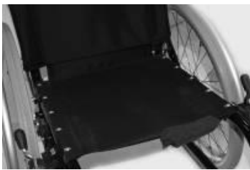
XFF 020002 Sitsklädsel med 1 miniväska