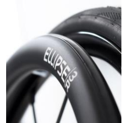
XFF070212 Ellipse 3R, svart