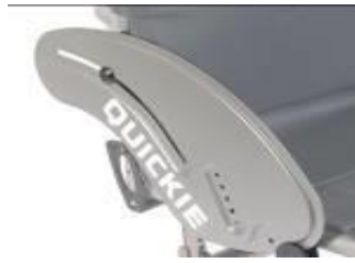
XFF040102 Sidoskydd, aluminium, utan stänkskärm