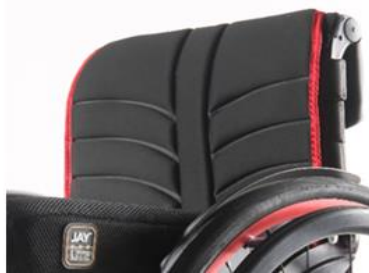
XFF 030316 EXO Evo ryggklädsel