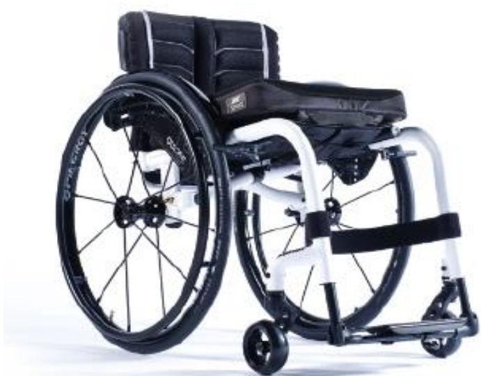
XFF010012 / 13 Öppen ram