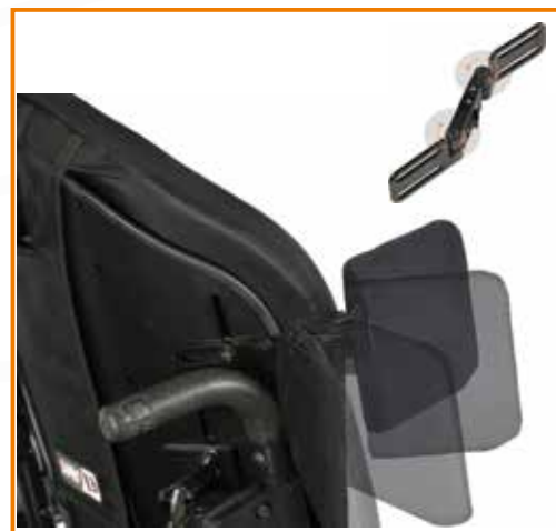
Sidosvängbart dubbelledat bålstöd