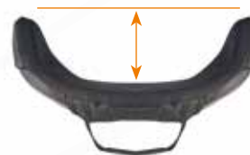
Djup kontur, extra djup Full lateral support