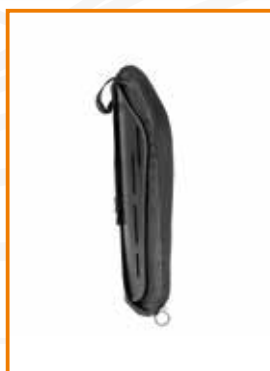
Mellan kontur Medium lateral support