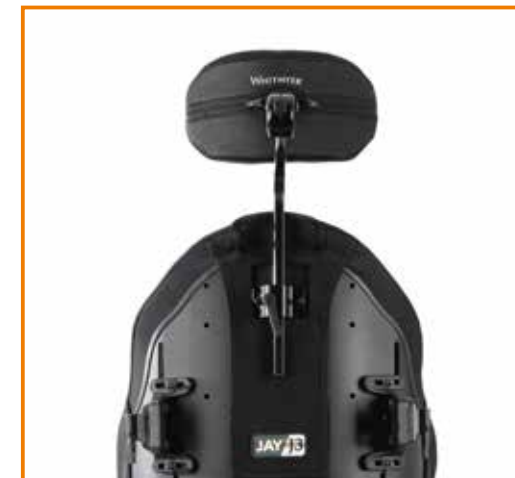
Whitmyer huvudstöd AXYS med Plush Pad