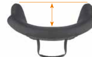
Rib kontur, extra djup Full lateral support