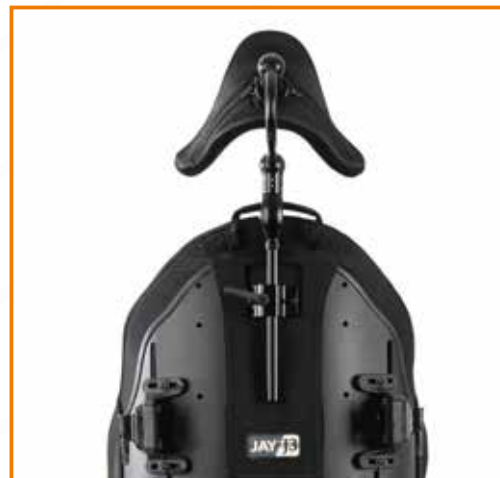
Whitmyer Huvudstöd Cobra Cradle Pad

Alla J3 ryggar som kan utrustas med huvudstöd har krocktestats enligt gällande ISO standard.