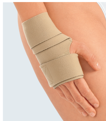
circaid juxtafit essentials hand wrap