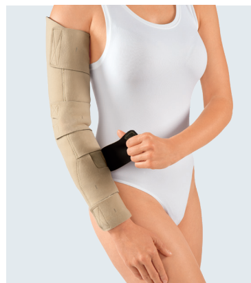
circaid juxtafit essentials arm