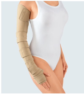
circaid juxtafit essentials arm med circaid juxtafit essentials hand wrap