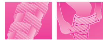
Juxtaposed band Easy handling