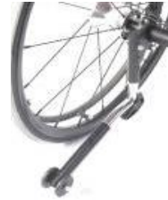
Tippskydd swing away