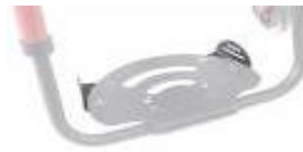
Positioneringsstöd till fotplatta