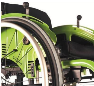
Sidoskydd aluminium med stänkskärm (här också med Safaribroms)