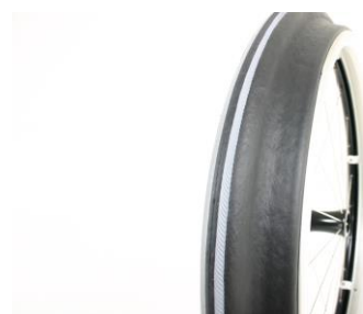
Drivring Maxgrepp ergo para cp