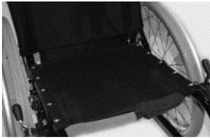
Sitsklädsel med en miniväska