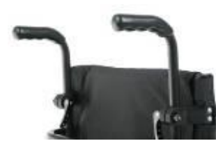
Körhandtag höj- och sänkbara