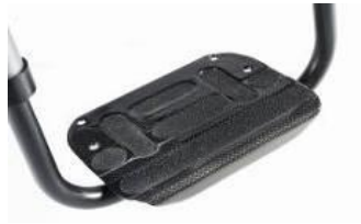
Fotplatta komposit, vinkel- och djupställbar