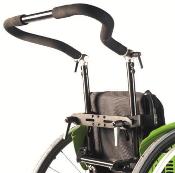
Körbåge, höjd-, vinkel- och breddjusterbar