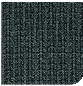
Ribbstickat finns i antracit och svart, endast i AD