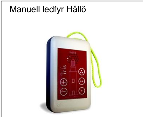
Manuell ledfyr Hållö