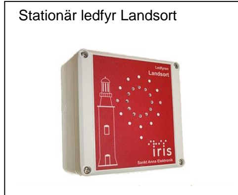
Stationär ledfyr Landsort