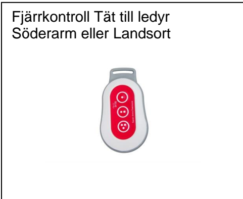
Fjärrkontroll Tät till ledyr Söderarm eller Landsort