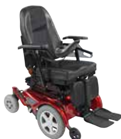
Invacare® FDX ®

G-Trac kommer att lägga mer körglädje till din Invacare elrullstol och hjälper dig på vägen för en bekväm och njutbar körupplevelse. Följande modeller kan kombineras med G-Trac :