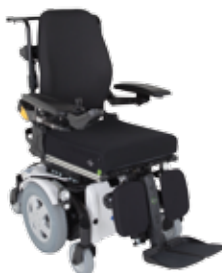
Invacare® TDX ® SP2