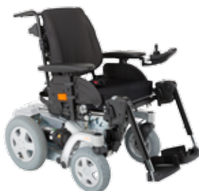
Invacare® Storm ®4 & Storm ®4 X-plore