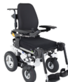
Invacare® Kite ®

Kundservice: 08-761 70 90 Fax 08-761 81 08 sweden@invacare.com www.invacare.se