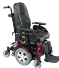
Invacare® TDX ® SP2 NB