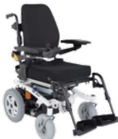
Invacare® Bora ®