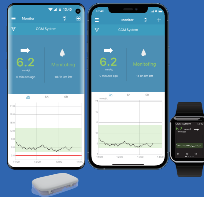
EasySense App (iOS & Android)