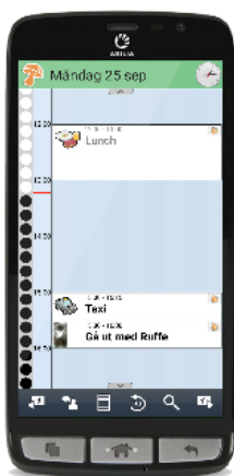
Kalendernyn med tidpelare

Du kan koppla en checklista till dina aktiviteter, till exempel vad du ska ta med till skolan eller träningen så att du kan vara säker på att du inte glömt något. Du kan också göra dina aktiviteter kvitterbara, vilket dels blir ett minnesstöd för dig, men även en trygghet för både dig och dina anhöriga då ni kan se om aktiviteten genomfördes, till exempel om du tagit din medicin.