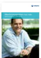
Blåstömning hos män – Blåstömning med hjälp av RIK