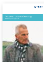
Godartad prostata- förstoring – Blåstömning med hjälp av RIK