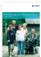
Förstoppning och avföringsinkontinens – Vattenlavemang

Hör gärna av dig till vår kundservice på tel. 0300-332 56, om du önskar beställa någon av dessa.