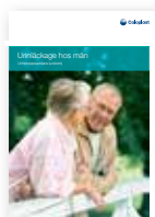
Urinläckage hos män – Urindroppssamlare (uridom)