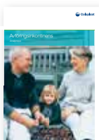
Avföringsinkontinens – Analpropp