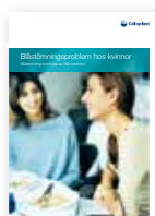
Blåstömning hos kvinnor – Blåstömning med hjälp av RIK

Coloplast har ett antal broschyrer där du får mer information om inkontinens och tömningsbesvär m.m.