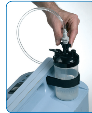
2. Anslut slangen till flaskan.