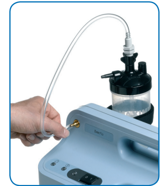
3. Anslut den andra änden till syrgasutloppet.