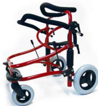
Miniwalk storlek 2

Standardutförande: Bålstödsring, sadel, fjädrar, handtagsbygel, parkeringsbromsar, avbärarhjul och massiva hjul.