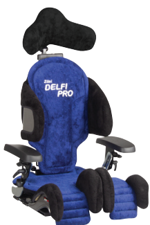
Delfi Pro stl. 4