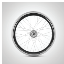
Drivhjul 20", 22", 24"