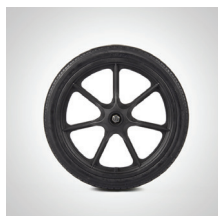
Drivhjul 12", 16"