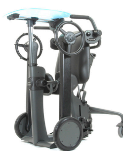
EasyStand Evolv Mobile