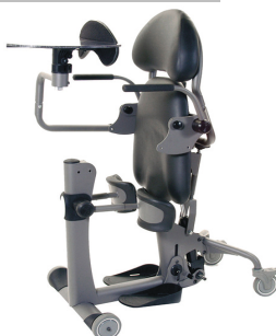
EasyStand Evolv II