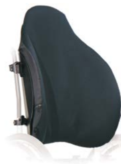
Evolution Ryggstöd, Djup