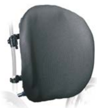
Evolution Ryggstöd, Låg