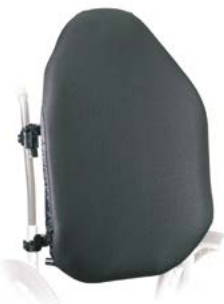
Evolution Ryggstöd, Hög