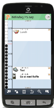
Kalendervyn med tidpelare

Du kan koppla en checklista eller anteckning till dina aktiviteter, till exempel vad du ska ta med till skolan eller träningen, så att du kan vara säker på att du inte glömt något. Du kan också göra dina aktiviteter kvitterbara, vilket blir ett minnesstöd för dig, men även en trygghet för både dig och dina anhöriga då ni kan se om dina aktiviteter genomfördes.