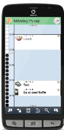
Kalendervyn med tidpelare

Du kan koppla en checklista till dina aktiviteter, till exempel vad du ska ta med till skolan eller träningen så att du kan vara säker på att du inte glömt något. Du kan också göra dina aktiviteter kvitterbara, vilket dels blir ett minnesstöd för dig, men även en trygghet för både dig och dina anhöriga då ni kan se om aktiviteten genomfördes, till exempel om du tagit din medicin.