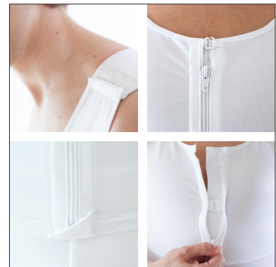
Justerbara axelband. Blixtlåås med hyskhak och mjukt skydd.