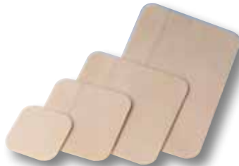
DuoDERM® E förband