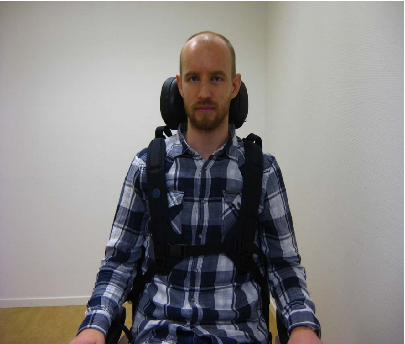
Montering på Ichair med ortoflex sittsystem och nackstöd