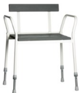
142005 + 142050