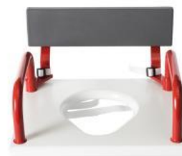
144900, hel sits