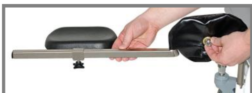
Vinkeljusterbara benstöd, Set Art. nr.: 310052 Höger, Art. nr.: 310053 Vänster, Art. nr.: 310054

Stödplattan är gjord av polyuretanskum som är mjukt, men ändå tillhandahåller ett bra stabilt stöd.