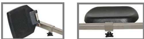
Benstödsplattan, höger, Art. nr.: 310085 Benstödsplattan vänster, Art. nr.: 310086 Ytterligare vadvstöd med konsoler, Art. nr. 310358

De ger brukaren ett bättre stöd om standardbenstöden inte är tillräckliga.