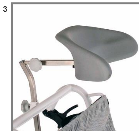
Nackstöd i PU skum Höjd & djupjusterbar, kort stav Art. nr.: 310244