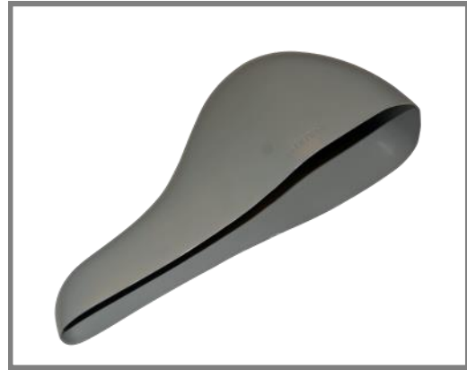
Urinfångar Art. nr.: 148861

Du håller urinfångaren med den smala änden i toaletten så att du kan bli av med urin utan det landar på golv eller toaletsits.