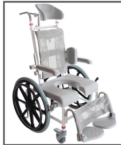
M2 Mini 20" Drivhjul