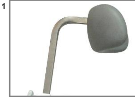
Nackstöd i Supersoft PU skum Vanligt, Art. nr.: 310236