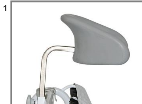
Nackstöd i PU skum Vanligt, Art. nr.: 310221

Den första modellen är justerbar på höjden och den andra och tredje modellen är höjd-, djup- och vinkelställbara.