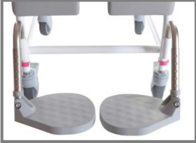
Benstöd Mini version Art. nr. 310510 Standard: Art. nr. 310049