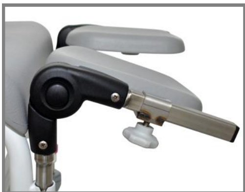
Amputationsbenstöd Höger, Art. nr. 800343 Vänster, Art. Nr.: 800344