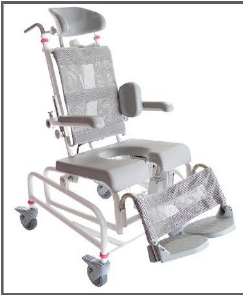
OBS: Stolen på bilden visas med tillbehör

M2 dusch- & toalettstol för barn och kortväxta som är svåra att placera i en vanlig stol eller har tendens att glida framåt i stolen.