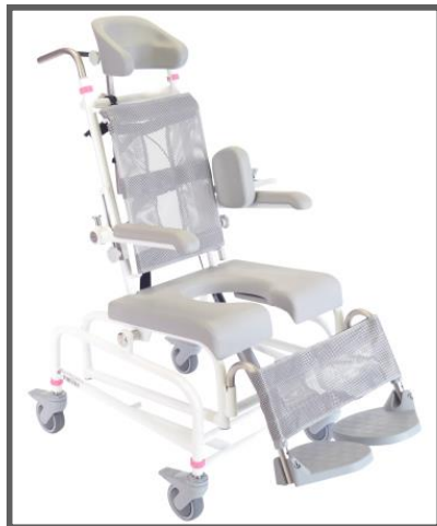
M2 Mini Gas-tip