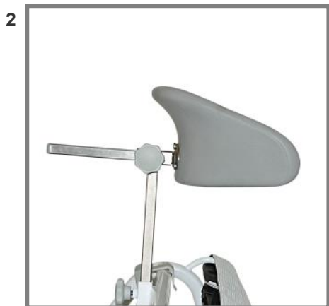
Nackstöd i PU skum Höjd & djupjusterbar, Art. nr.: 310222