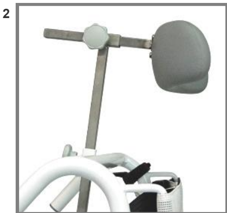
Nackstöd i Supersoft PU skum Höjd & djupjusterbar, Art. nr.: 310235

Den första modellen är justerbar på höjden och den andra och tredje modellen är höjd-, djup- och vinkelställbara.