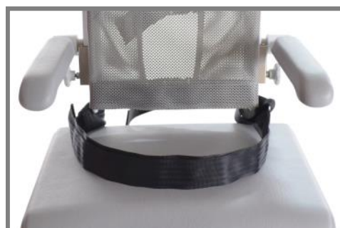
Höftsele för Mini Artikel nr.: 310515

Höftsele passar enkelt på ramen och justeras med hjälp av kardborreband.