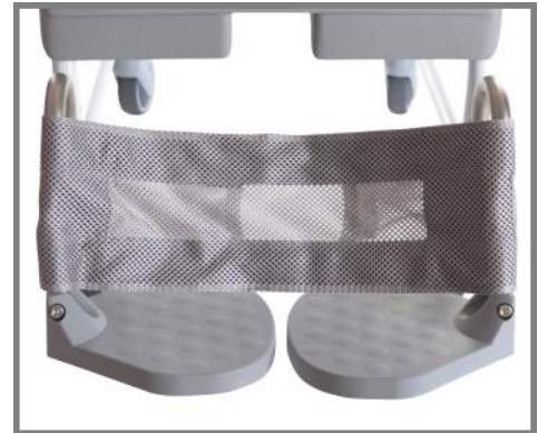
Vadband Art. nr.: 310226

Vadbandet stödjer hela underbenet vilket ger användaren större komfort och säkerhet.