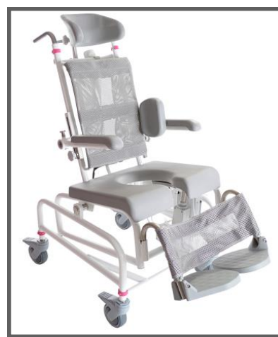
M2 Mini El-tip