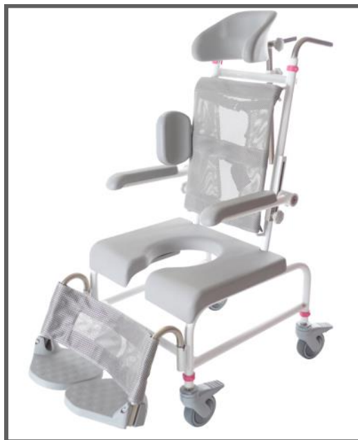
OBS: Stolen på bilden visas med tillbehör

Flera av delarna på stolen kan justeras under tiden barnet växer. Stolen blir ett stabilt stöd i brukarens dagliga liv under många år.