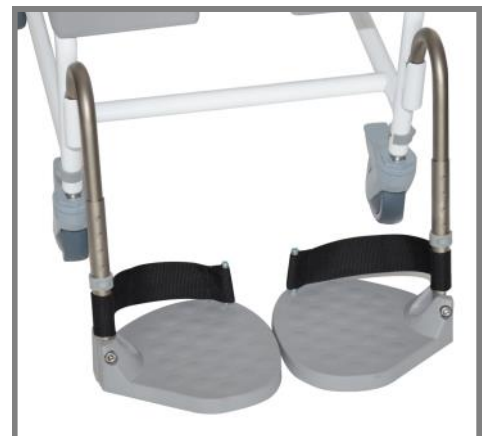
Tillägg för Hälband monterad Art. nr.: 310285

Med hälband monterad kan du fortfarande svänga fotstödet åt sidan.