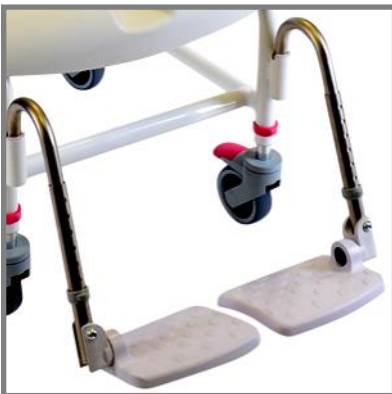
Höjinställbara benstöd: Art. nr.: 313041

De finns i en Mini version (31-41 cm från kanten av sitsen till bottenplattan)