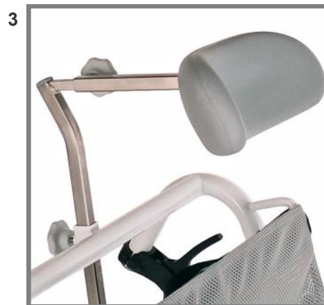
Nackstöd i Supersoft PU skum Höjd & djupjusterbar, kort stav Art. nr.: 310243