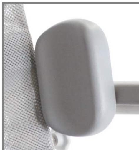
Bålstöd för Mini, Set Art. Nr.: 310512 Höger, Art. nr.: 310514 Vänster, Art.nr.: 310513

För långa brukare kan bålstöd vändas och ge stöd högre upp.