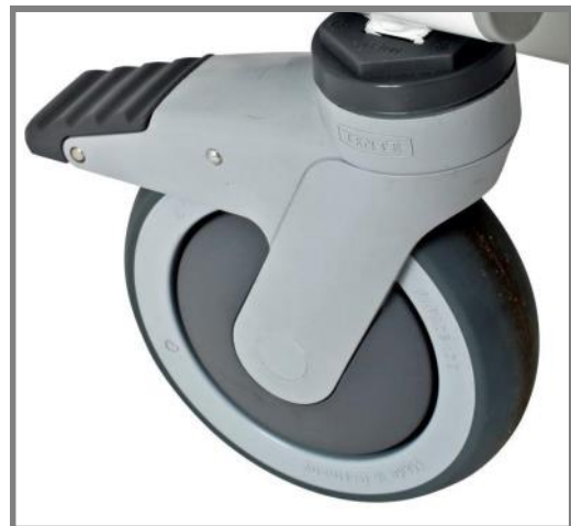
Tillägg för stolen levereras med 1 riktning fast hjul, Art. nr.: 800157

Manövrering av stolen blir lättare och vårdarens arbetsmiljö skönare.