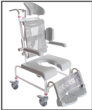
M2 Mini Standard

M2 Mini-modellerna är flexibla dusch- & toalettstolar och kan enkelt justeras medan barnet växer.