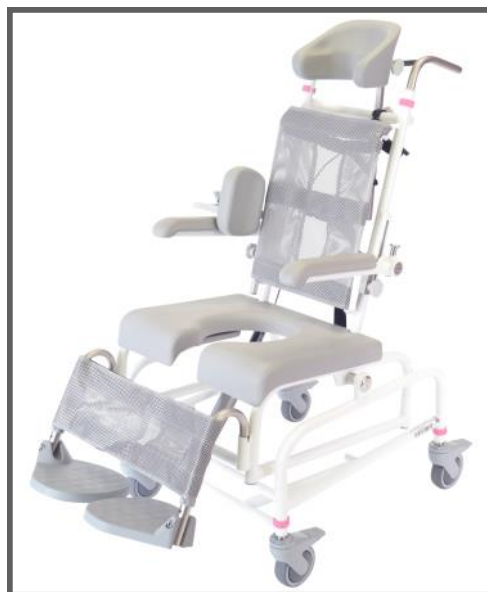
OBS: Stolen på bilden visas med tillbehör

Stolen är anpassad för både brukare som måste lyftas och dem som kan stå själv.