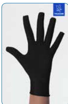
Art nr 344802 Kort handske slutna fingrar

Varianter Storlek 1-8 Färg: Beige, Svart