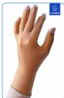
Art nr 344803 Kort handske öppna fingrar

Varianter Storlek 1-8 Färg: Beige, Svart