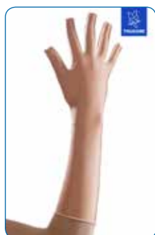
Art nr 344801 Lång handske slutna fingrar

Varianter Storlek 1-8 Färg: Beige, Svart