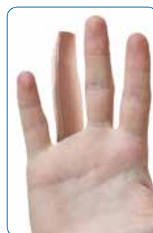
Art nr 344601 Fingerstrumpa

Varianter Storlek 1-8 Färg: Beige, Svart