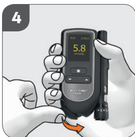
4. Läs av resultatet och stäng skyddsluckan

▶▶ Testremsefria Accu-Chek Mobile gör det enkelt att mäta blodsockret, särskilt för insulinbehandlade.