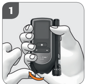
1. Öppna skyddsluckan