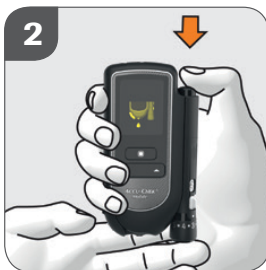
2. Tag ett blodprov