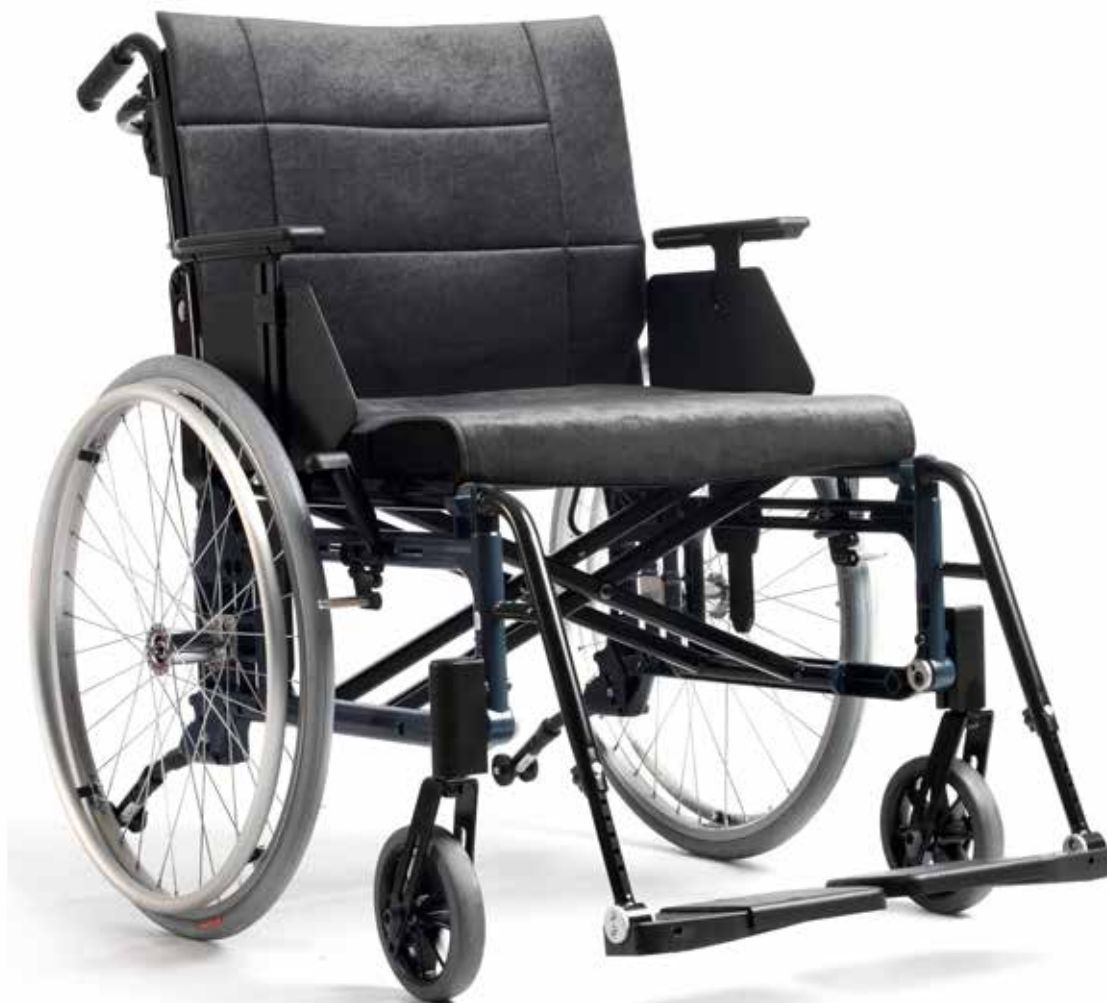
Etac Cross 5 XL

Etac Cross 5 XL har samma kvaliteter och egenskaper som en Cross 5. För att klara en tuff belastning är ryggstödet förstärkt med ett fällbart tvärstag. Cross 5 XL finns i sitsbredder upp till 60 cm och klarar en brukarvikt på 160 kg. Den har samma inställningsmöjligheter och stora tillbehörsprogram som Cross 5 och finns även med vårdarbroms.