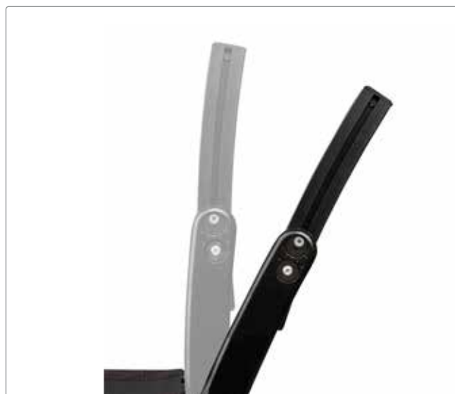
Justerbar vinkel mellan ryggstöd och sits (höft)

Reglerbar från -5^{\circ} till +20^{\circ} .