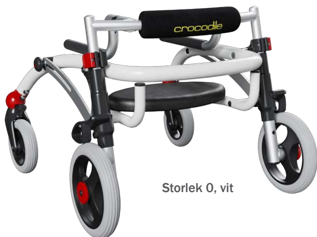
Storlek 0, vit

Crocodile är en bakåtvänd rollator för det aktiva barnet som både kan och vill göra lite mer. Rollatorn används bakom barnet vilket ger optimalt stöd och ett bra gångmönster.