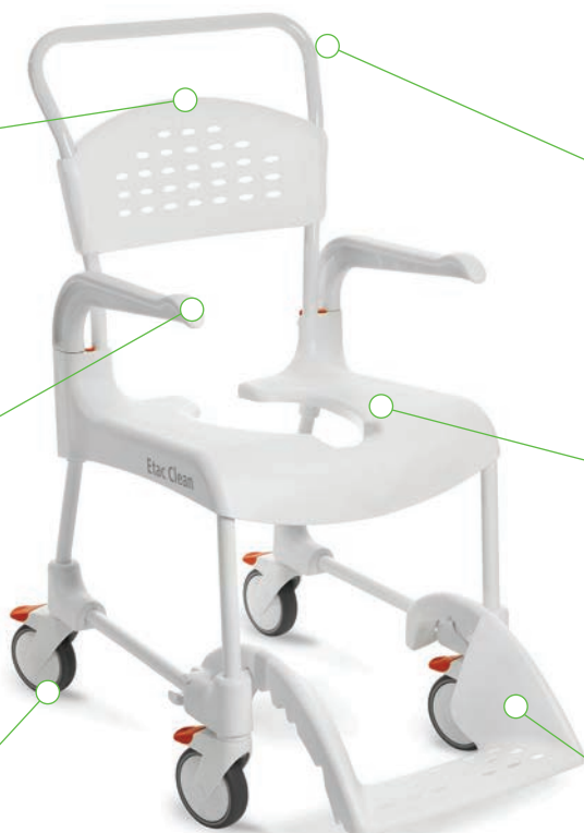
Clean, standard modell

Ett unikt fotstöd som fälls in under stolen när det inte används. Rundad form på fotplattan för komfort och avslappning.