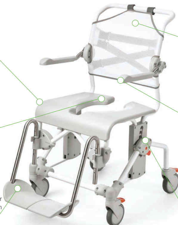
Swift Mobil -2, standard modell

Enkel att justera till olika sitshöjder, utan behov av verktyg.