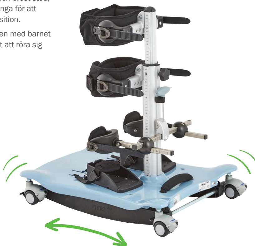
R82 Meerkat stl 1, blå