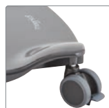
Stl 2+3 - grå