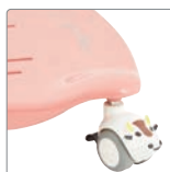
Stl 1 - rosa