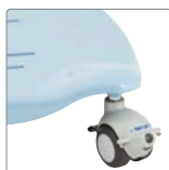
Stl 1 - blå